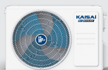
Jednostka zewnętrzna KLWB