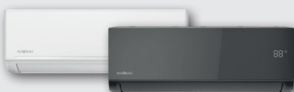
Jednostka wewnętrzna KLW/KLB