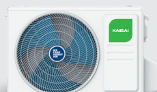
Jednostka zewnętrzna KWX