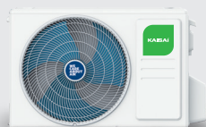
Jednostka zewnętrzna KGE