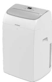
Jednostka wewnętrzna KKPE-12PTA1